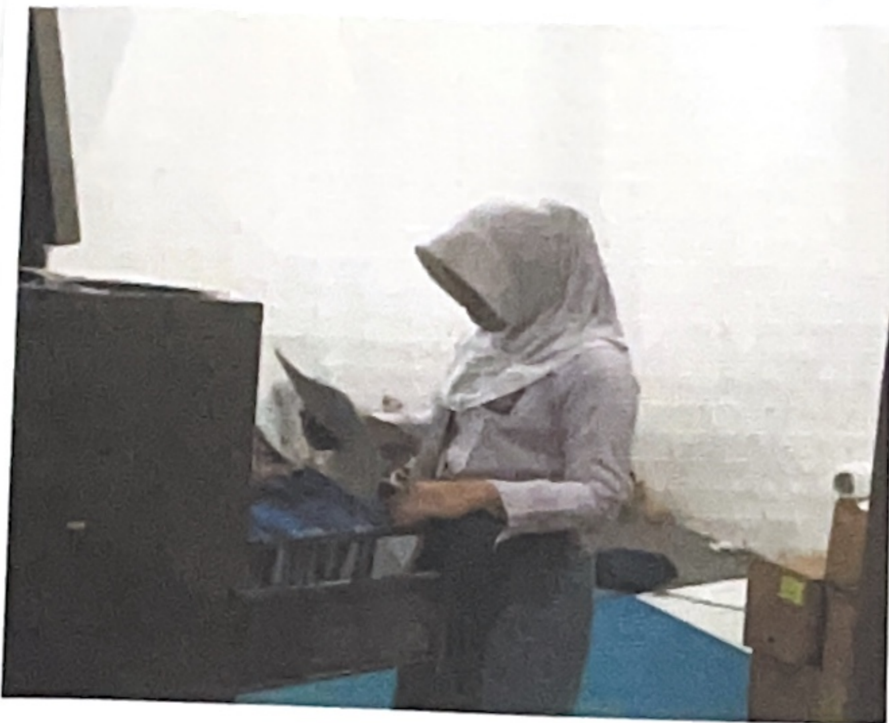
Gambar 1.1 Mengelola Arsip