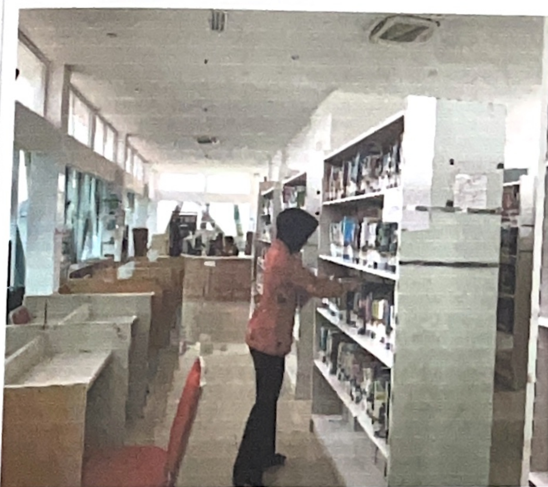
Gambar 1.3 Menerapkan k3 Perkantoran