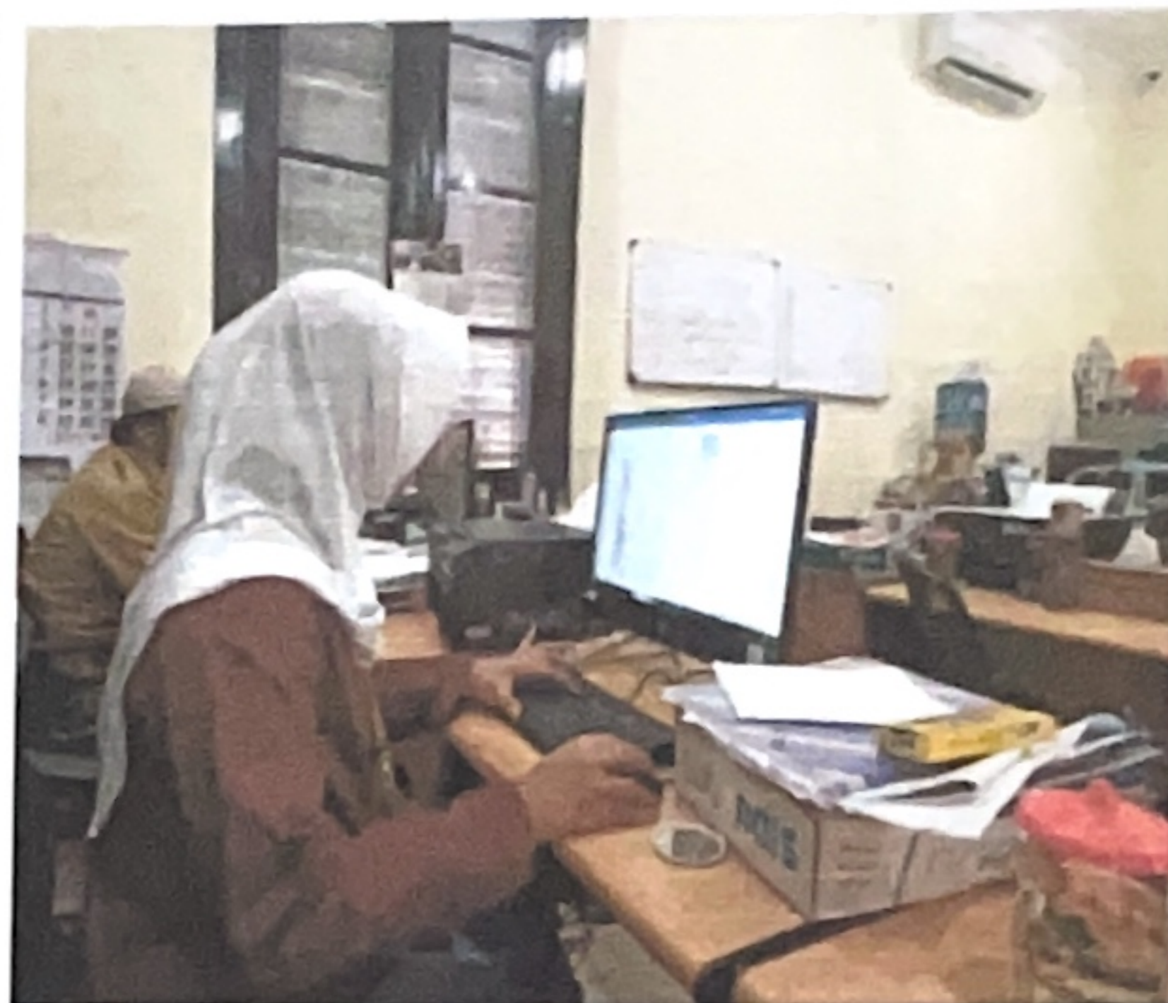
Gambar 1.2 Mengakses Data di Komputer